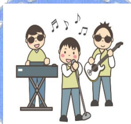
つばさバンドの演奏♪