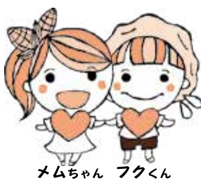
めむちゃん フクくん

芽室町社会福祉協議会は、地域福祉事業と介護保険事業が一体となり、「支えたり」「支えられたりする」地域共生型のめむろの実現を目指します。