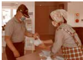
7目ご飯のテイクアウト

は久しぶりというトトロの皆さんに調理、個人登録ボランティア3名にホールと受付を担当していただきました。「久しぶり」の笑顔とおいしい匂いに満たされた「なごみ」でした。ご来店・ご協力ありがとうございました。