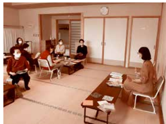
消費者協会による特殊サギの講話