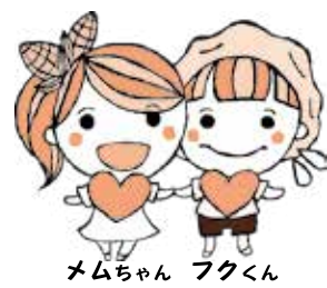
メムちゃん フクくん

芽室町社会福祉協議会は、地域福祉事業と介護保険事業が一体となり、「支えたり」「支えられたりする」地域共生型のめむろの実現を目指します。