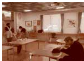
トトロのカレーライス