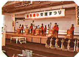
「メムオロ子供太鼓」