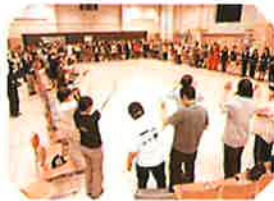
「ミュージック・ケア」