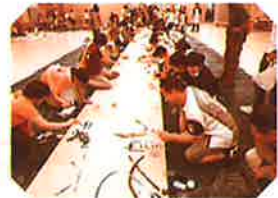
「ペイントワークショップ」