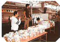
「チャリティーオークション」