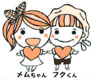
ムムちゃん フクくん