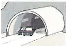
【トンネルの出入口】