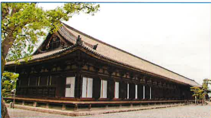
威容を誇る三十三間堂