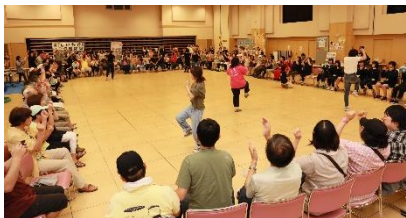
*ミュージック・ケアの様子(ふれあい交流まつり)

*ミュージック・ケア…音楽の特性の一部を利用して、その人がその人らしく生きるための援助をすることであり、子どもの場合はその子どもの持っている力を最大限に発揮させ、発達の援助を行うことである。(日本ミュージックケア協会HPより抜粋)