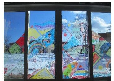
カラフルな山脈も完成♪