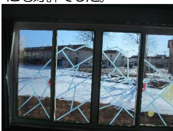
マスキングテープで枠づくり