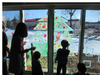
好きな飾りを描きます