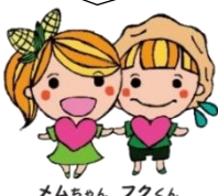
メムちゃん フクくん

住 所: 芽室町西4条4丁目1番地7 ふれあいサロン「なごみ」内 電 話: 61-3631 FAX: 66-9169 メール: kashiwaba@memuro-syakyjo.jp 開設時間: 火~土 9時~17時30分 ※日・月・祝日はお休みですが、土曜日は祝日も開設しています。 http://www.memuro-syakyjo.jp ブログ: nagomi.kakuren-bo.com/