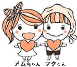
メモちゃん フクくん