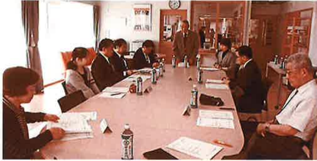
芽室町ボランティアセンター運営委員会委員(敬称略)