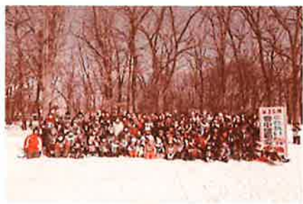
大勢の方が参加したふれあい雪中運動会