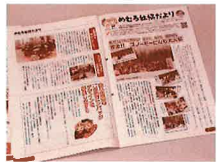
毎月お届けしている「社協だより」