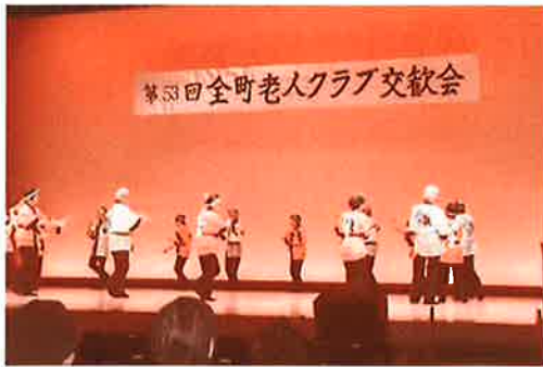
毎年楽しい出し物の老人クラブ交歓会