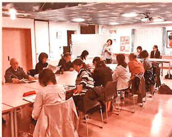
支援センターの役割を再確認したフォローアップ研修

また、今回の研修で修了生の中から今後の研修内容を検討していくグループも決まり、ゆっくりではありますが着々と市民後見人同士の活動の輪が広がっています。