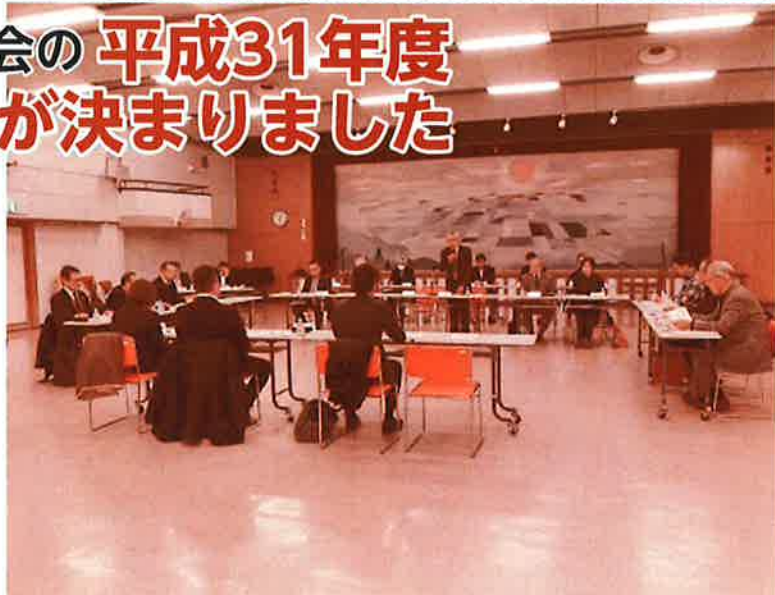
新年度の事業計画と予算を審議した評議員会