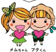
メムちゃん フクくん

http://www.memuro-syakyjo.jp ブログ: nagomi.kakuren-bo.com/