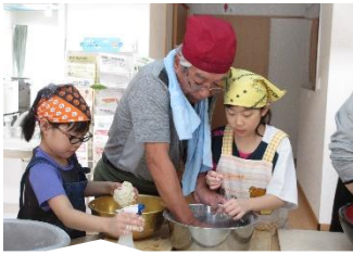
1/27(土)手打ちうどん教室の様子

ボランティアセンターでは、地域で活躍している方々や趣味・特技がある方々を講師としてお招きし、フラットな関係のもと、季節に応じた内容の教室を実施しています。これまで、お料理やお菓子作り、フラワーアレンジメント、手芸、陶芸、ニュースポーツ、ボランティア活動のお話など、様々な先生をお迎えしてきました。ご自身が楽しんでいる趣味や特技、活動を多くの方と一緒に楽しみたい、お知らせしたいという方を募集しています。「この方に教えてもらいたい」という情報もお待ちしています。