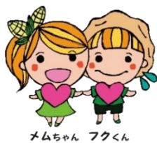
メムちゃん フクくん