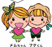
メムちゃん フクくん